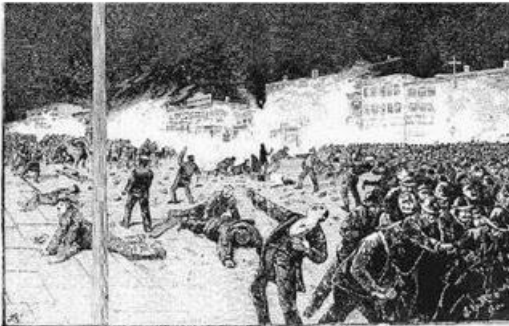
The police attack on the workers demonstration at Haymarket, Chicago 1885

χιλιάδες εργαζόμενοι κατέβηκαν σε απεργίες. Το κύριο αίτημα ήταν για 8ωρο στη δουλειά. Μέχρι τότε η εργάσιμη μέρα ήταν 10, 12 ή ακόμα και 14 ώρες, ενώ πολλές φορές οι εργαζόμενοι/ες υποχρεώνονταν να δουλεύουν και Κυριακές.